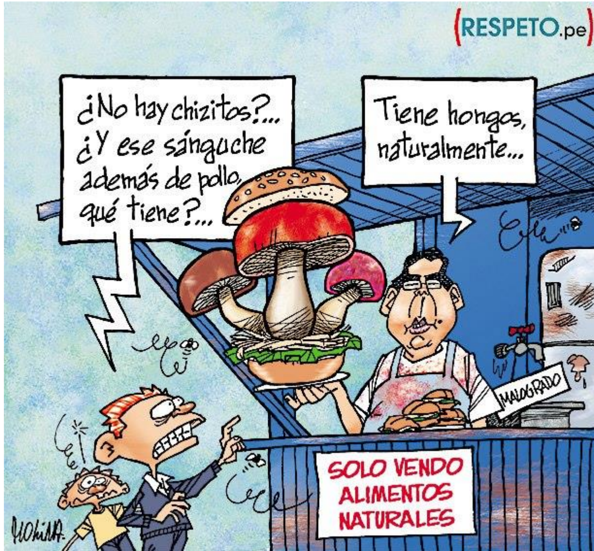
LIBERTAD DE ELEGIR VS. IMPRACTIBILIDAD