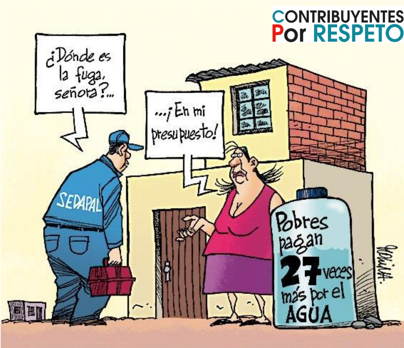
EMPRESAS PÚBLICAS NO VS. IMPACTO EN POBREZA